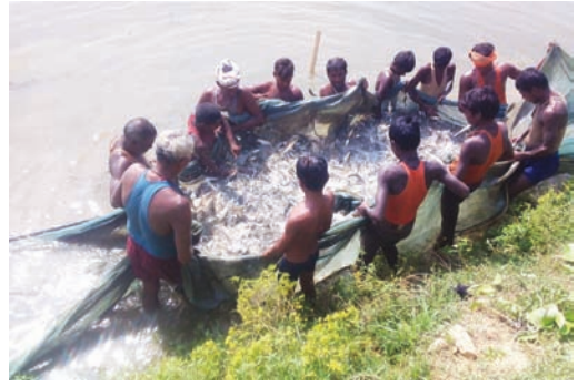
छडी माछा हार्नेस्टिङ्ग, बारा