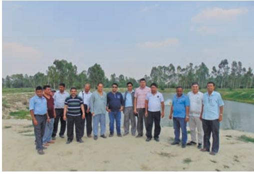
मत्स्य विकास कार्यक्रम केन्द्रीय अनुगमन, महोत्तरी