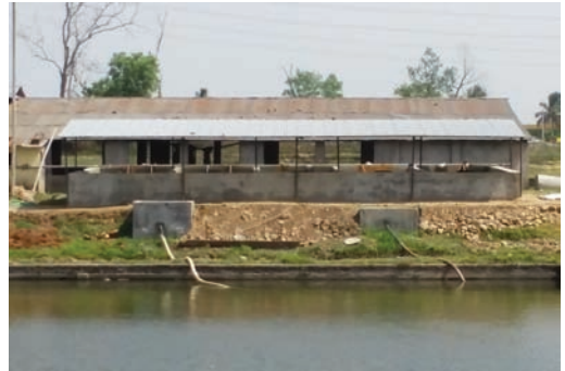
आउट डोर ह्याचलिङ्ग नर्सिङ्ग ट्यांक, फत्तेपुर