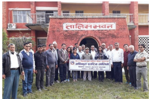
अधिकृत स्तरीय तालिम, जनकपुर