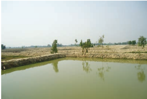
मत्स्य पालन पोखरी, धनुषा