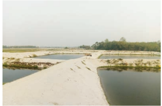
मत्स्य नर्सरी पोखरी, सुनसरी