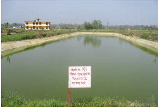
माउ माछा पोखरी सम्शेरगञ्ज, बाँके