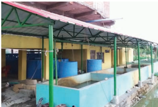
पटेल पंगासियस मत्स्य प्रजनन केन्द्र, पश्चिम नवलपरासी